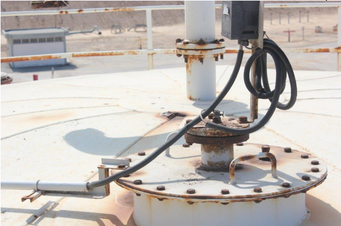
סעיף 4.2.2.9 :