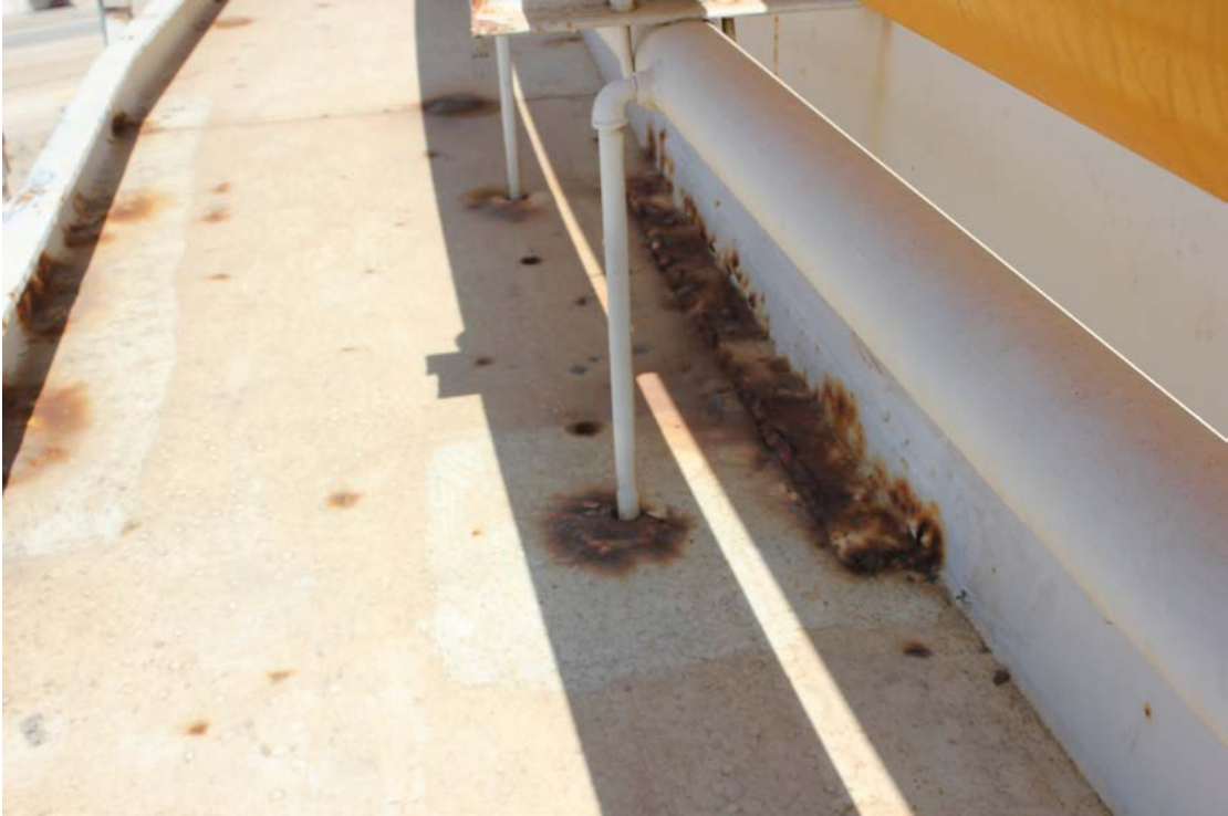
סעיף 4.2.1.4 :