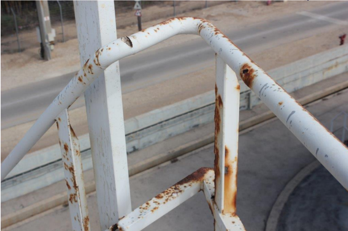
סעיף 4.2.2.5 :