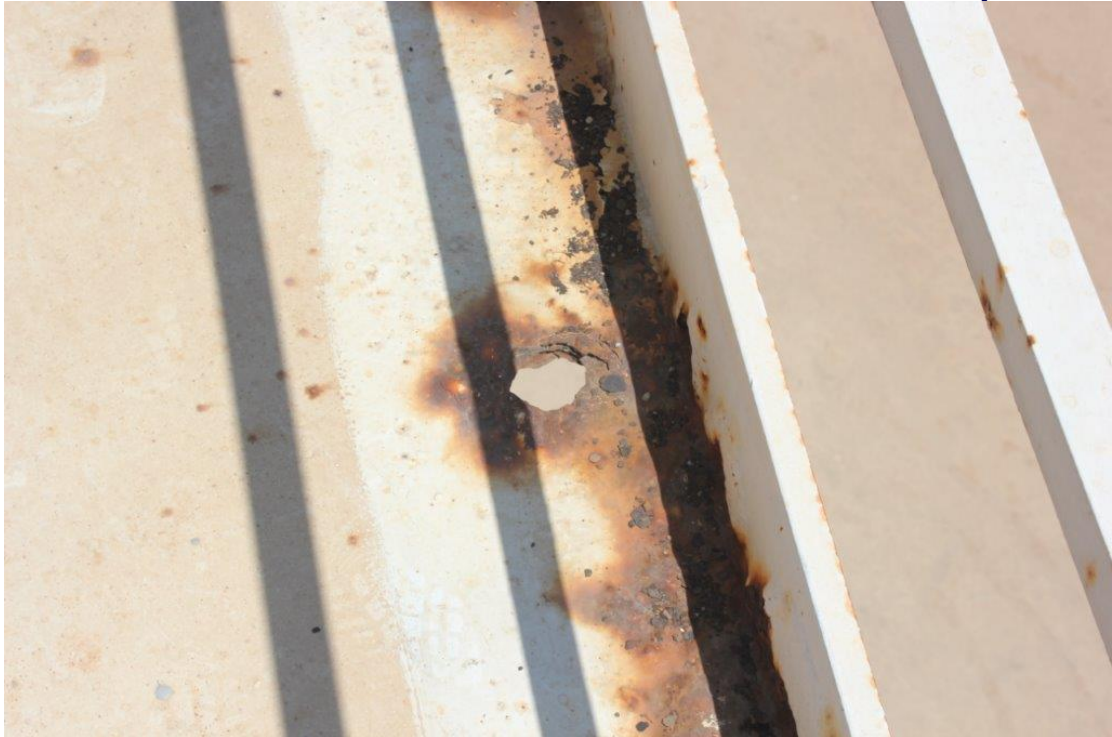
סעיף 4.2.1.5 :